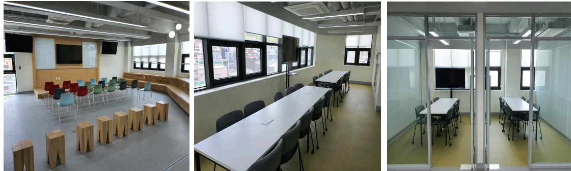
컨퍼런스 룸 / 다목적 대회의실

3) 문의사항 : 4Lab 행정실 (6층) 042) 630-9784 / 9785